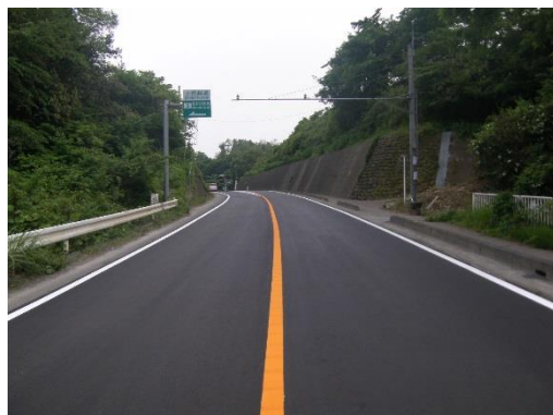
(1) 松井田下仁田線（五料外）