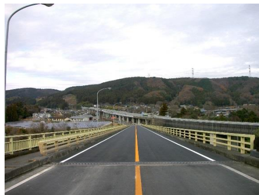
(2) 松井田下仁田線（松井田大橋）