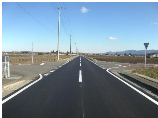
(3) 松井田中宿線（鷺宮外）